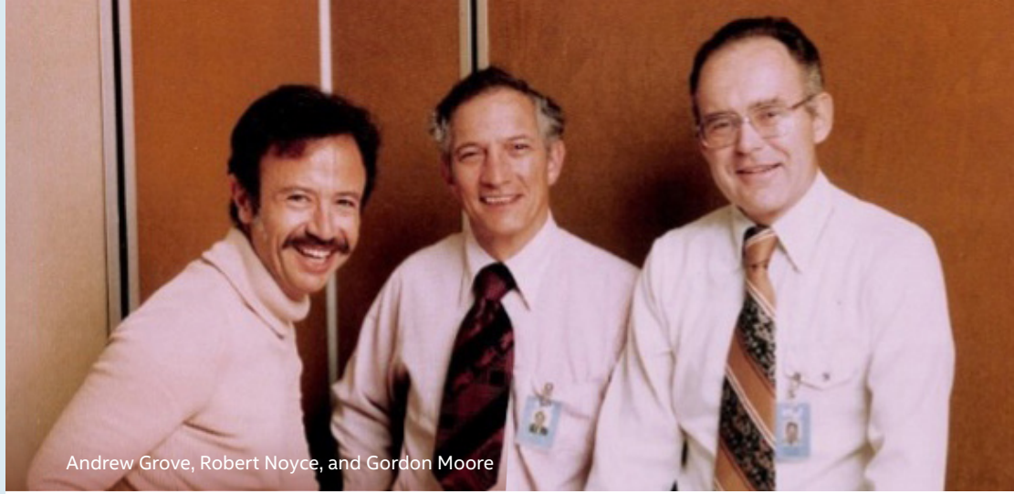
Andrew Grove, Robert Noyce, and Gordon Moore